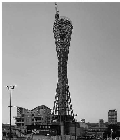
神戸ポートタワー (32本の直線で構成された一葉双曲線)

1995年の阪神・淡路大震災では一帯が液状化で壊滅的な被害を受けましたが、神戸ポートタワーはほとんど損傷を受けませ