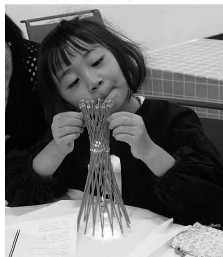
ワークショップ「ミニポートタワーをつくろう」 (作品が完成し内部照明を調整する)

(公社)日本建築家協会 近畿支部 兵庫地域会と神戸松蔭女子学院大学は、神戸ポートタワーの曲線美の秘密を学ぶワークショップ「ミニポートタワーをつくろう」を開催しています。32本の鋼管で構成された一葉双曲線は、明快な構造形式でありながら美し