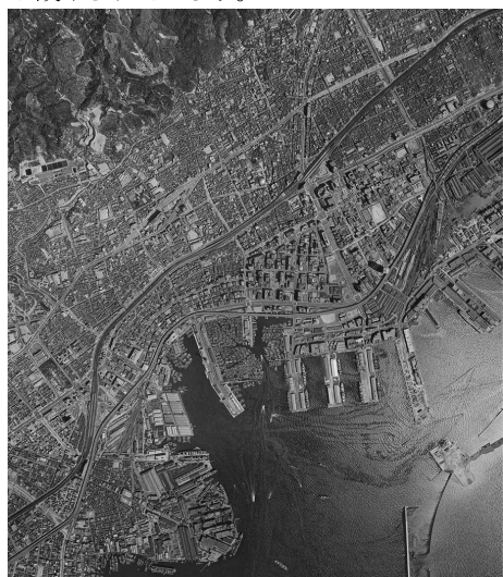
1969年の神戸の航空写真 (神戸ポートタワーや神戸臨港線などが見える)

第二次世界大戦を経て、神戸の人口は戦前の4割に減少し住宅や工場の殆どが被害を受けました。戦後復興期は重化学工業を中心に経済成長を続け、工場用地確保のため臨海部の埋め立てが進められます。臨海部には神戸製鋼所、川崎重工業、三菱電機などが拠点を置き神戸港の運輸機能と相乗効果を生みました。復興と発展のシンボルとして神戸ポートタワー建設が始まりますが、土留めの鋼矢板が地中障害物で損傷し湧水が大量に侵入して工事が難航しました。必死の湧水対策と並行して、265本の杭打ち込みとスラブ厚3.5mのコンクリート打設が進められます。約500㎡という建築面積に対して相当な本数の杭が打たれ、さらに外周部の一部の杭に引抜抵抗を期待することでタワー転倒防止が図られました。軽やかな姿をしたタワーの一方で、軟弱地盤での地震力に耐えるよう地中に堅固な構造が設けられています。